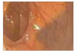
قولون نظيف = رؤية جيدة

بعد تنظيف القولون بشكل جيد، سيبدو كما في الصورة أعلى اليسار.